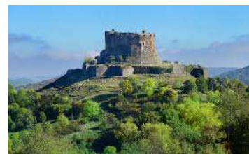
Château de Murot (63)

Voyager au temps des chevaliers, des croisades, et des joutes équestres et des ripailles.